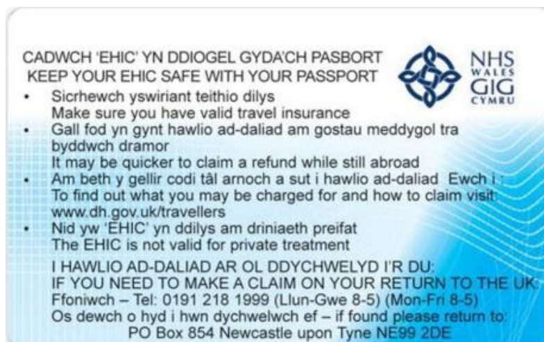
Rückseite Vereinigtes Königreich – Wales