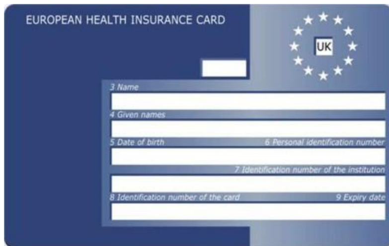
Vorderseite Königreich – England – Schottland