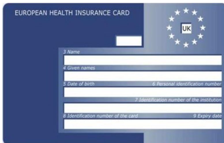
Vorderseite Vereinigtes Königreich – Wales