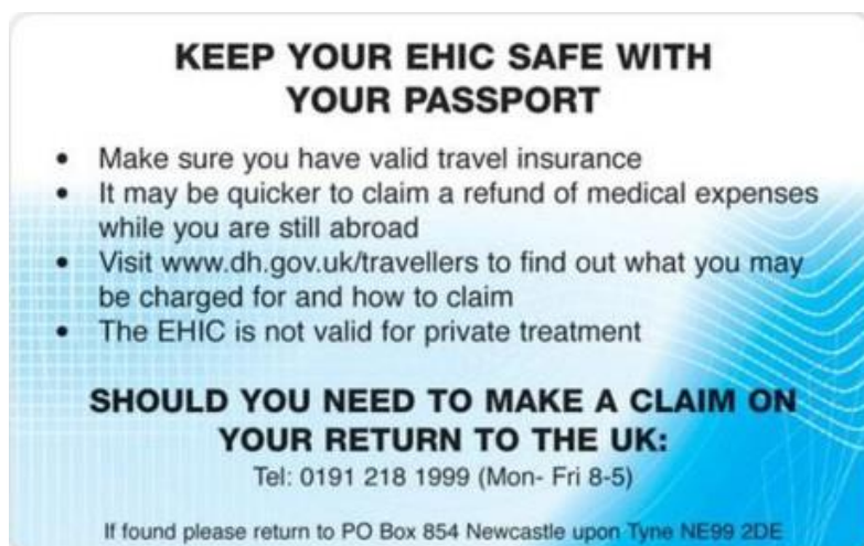
Rückseite Vereinigtes Königreich – England – Schottland